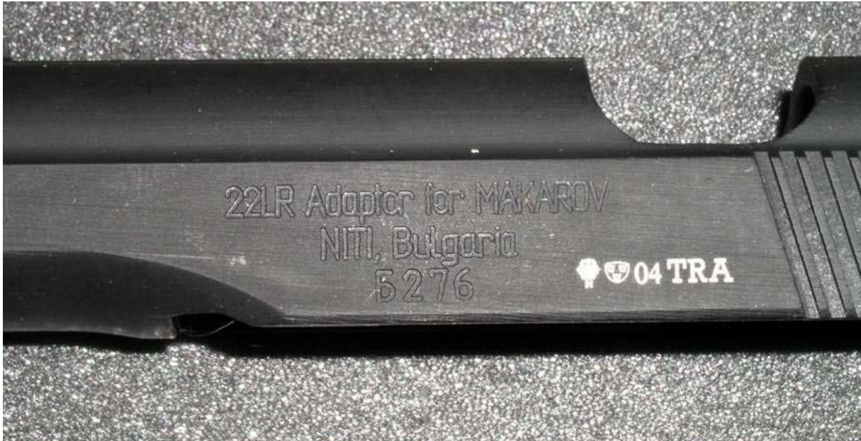
Bulgarien Adapter, mit Euro-Zeichen

Die Jagd auf diese 22er Umbausätze für die Makarov war lange Zeit erfolglos. Anfang 2004 setzte sich Makarov.com mit einem Importeur in Verbindung und sicherte sich weniger als 50 Stück der bulgarischen Umbausätze. Diese Umbausätze waren in Amerika in einer Rekordzeit von neun Stunden ab dem Zeitpunkt der ersten Ankündigung verkauft.