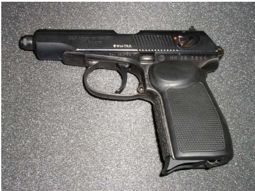
Makarov Pistole mit 22 Umbausatz installiert